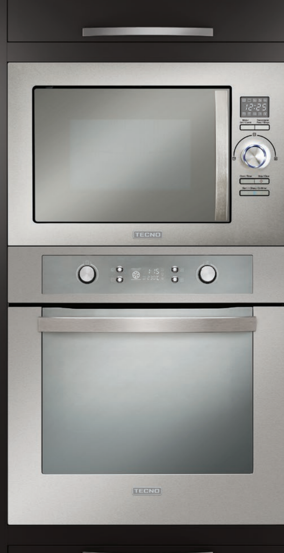
Forno LARGE TO72