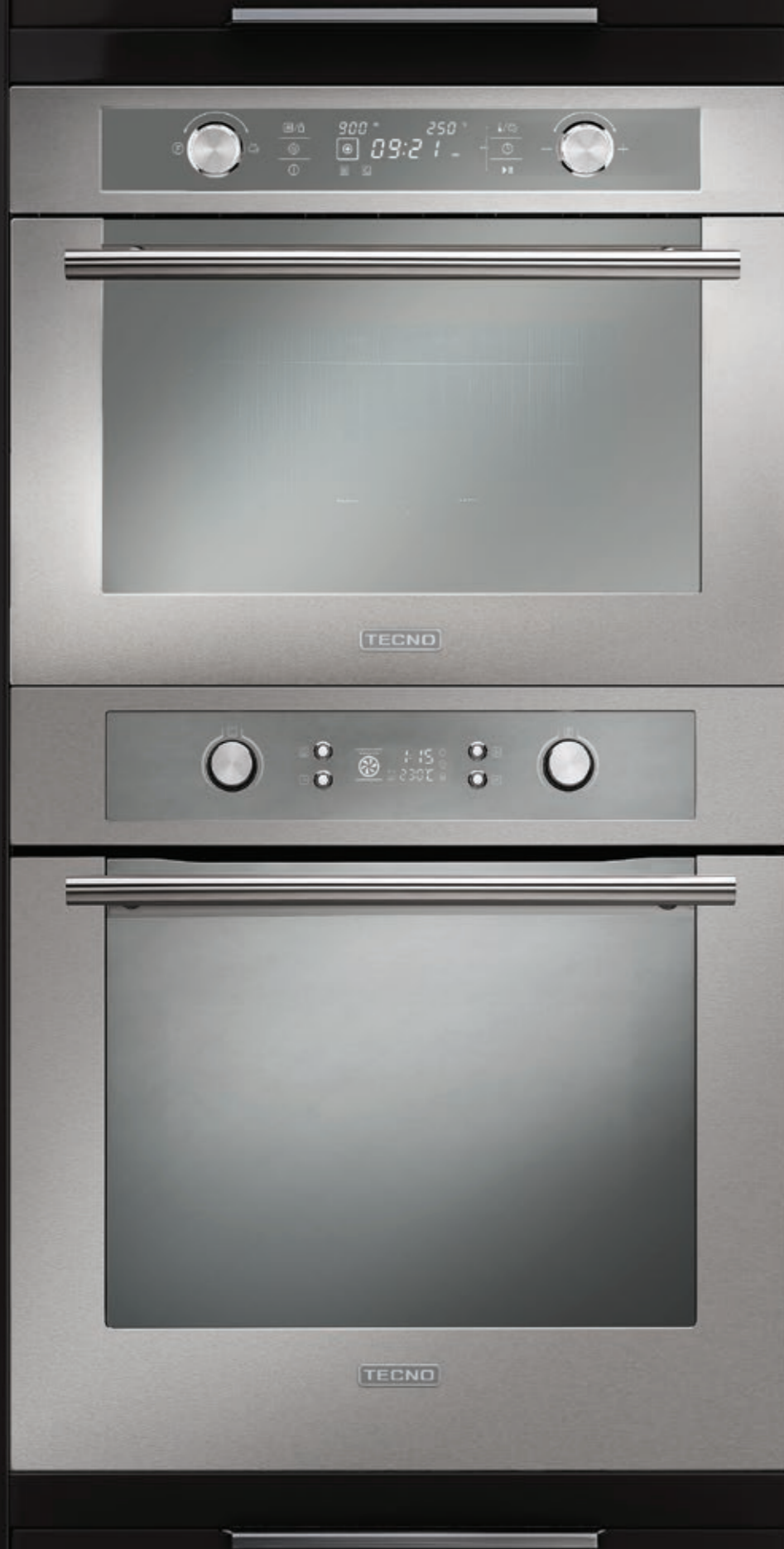
Forno LARGE TO72