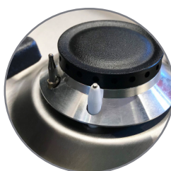
Gas Control System